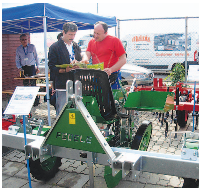
Alfagép Kft. A csabai vállalkozás a kertészeti gépek széles kínálatát mutatta be.