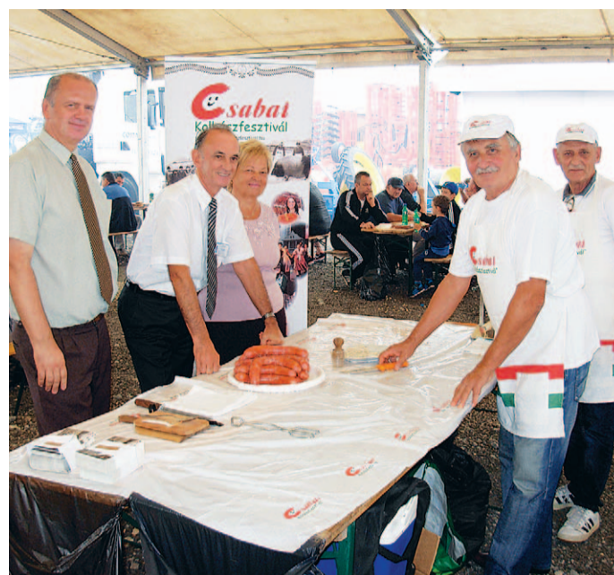
A Csabai Kolbászfesztivál gyűrási bemutatója a Körös-Trade szervezésében.

működést. A kedvező tapasztalatok, a két szervezet több éve fennálló szoros és jó kapcsolata alapján az együttműködés folytatásáról, illetve a bővítési lehetőségekről állapodtak meg. A tárgyalást követően a Békés Megyei Mezőgazdasági Szövetség képviselői megtekintették az agrárkiállítást – tudósított a kétoldalú egyezmény meghosszabbításának eseményéről Vári Attila, a MOSZ Békés megyei instruktora.