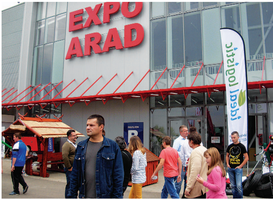
Az aradi vásárlóközpontban rendezett Agromalim a román mezőgazdaság bemutatása mellett a magyar–román kapcsolatépítésnek és a határon innen és túl magyar gazdák találkozájának is fontos rendezvénye.