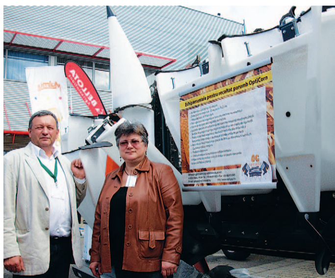
Napraforgó-, kukoricaadapterek az Optigéptől. Romániában közkedvelt eszközök.