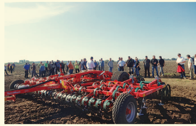
Munkában a TerraMaxx magágykészítő szántóföldi kultivátor.

Az Alfa-Gép kínálatában szereplő teljes Vogel-Noot termékpaletta – a szántástól a vetésig – egy innovatív technológiával előállított gépsor garanciáját nyújtja, amely egybehangozóan az üzemeltetők sikerét biztosítja.